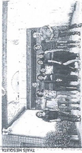
EQUIPE da 29ª turma dos Novos talento O POVO

verdadeiras às pessoas, combatendo a desinformação", analisa. Exclusivamente on-line, as inscrições devem ser feitas pela página oficial do programa: furo.org.br/novostalento .