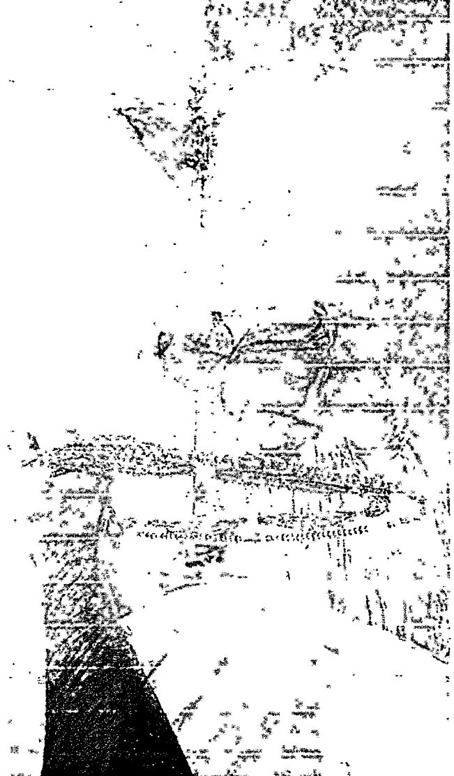
NA PRAIA de Iracema, mães, pais e filhos de

PREFEITURA DE ANTONINA DO NORTE-CE COMISSÃO DE LICITAÇÃO PAG. 224