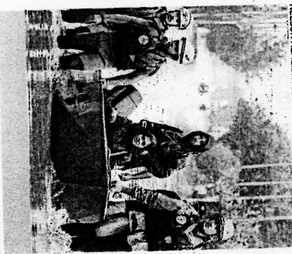
O FIM DE semana foi de muitas chuvas no RS

pontos de alagamento, em alguns dos 446 municípios afetados. Foram salvos também 10.555 animais.